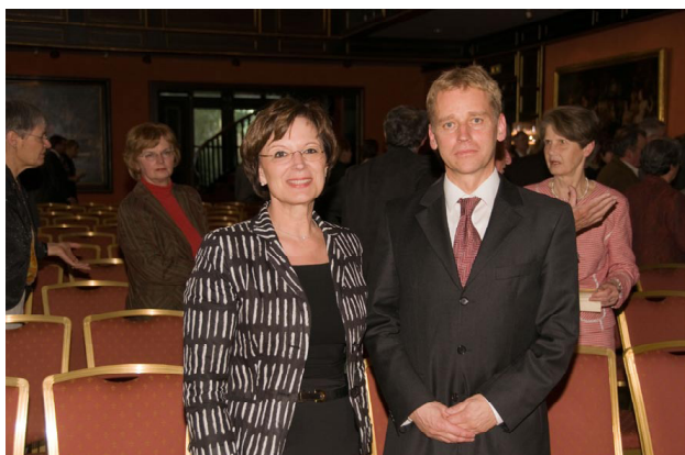
Staatsministerin für Bundes- und Europaangelegenheiten Frau Emilia Müller und der Generalkonsul der Republik Slowenien Marko Vrevc

Unter den zahlreichen Gästen waren die bayerische Staatsministerin für Bundes- und Europaangelegenheiten, viele Vertreter des Konsularischen Corps, Mitglieder der slowenischen Kulturvereine aus Bayern und Baden-Württemberg und des öffentlichen Lebens.