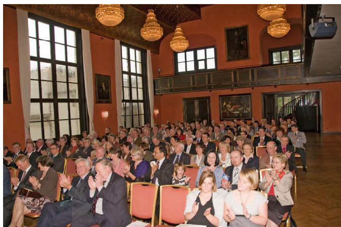
Festsaal des Münchner Künstlerhauses